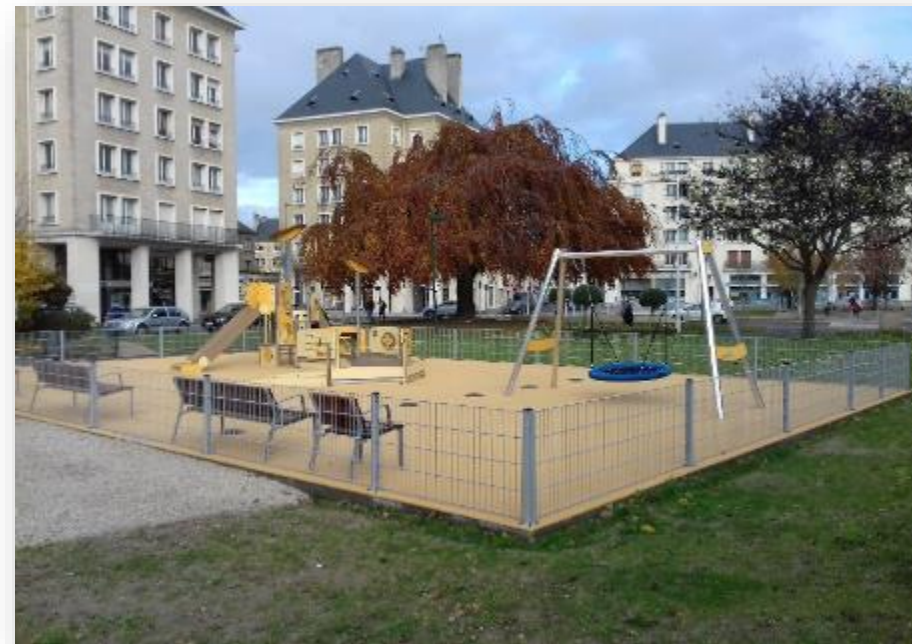
Mise en accessibilité PMR du square Jean Soreth à proximité de la place de la Résistance