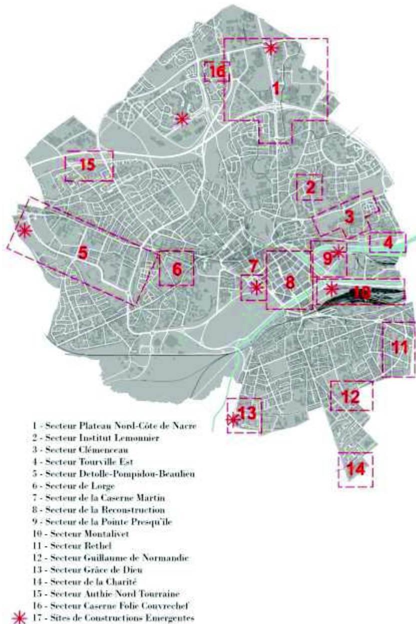
Localisation des OAP