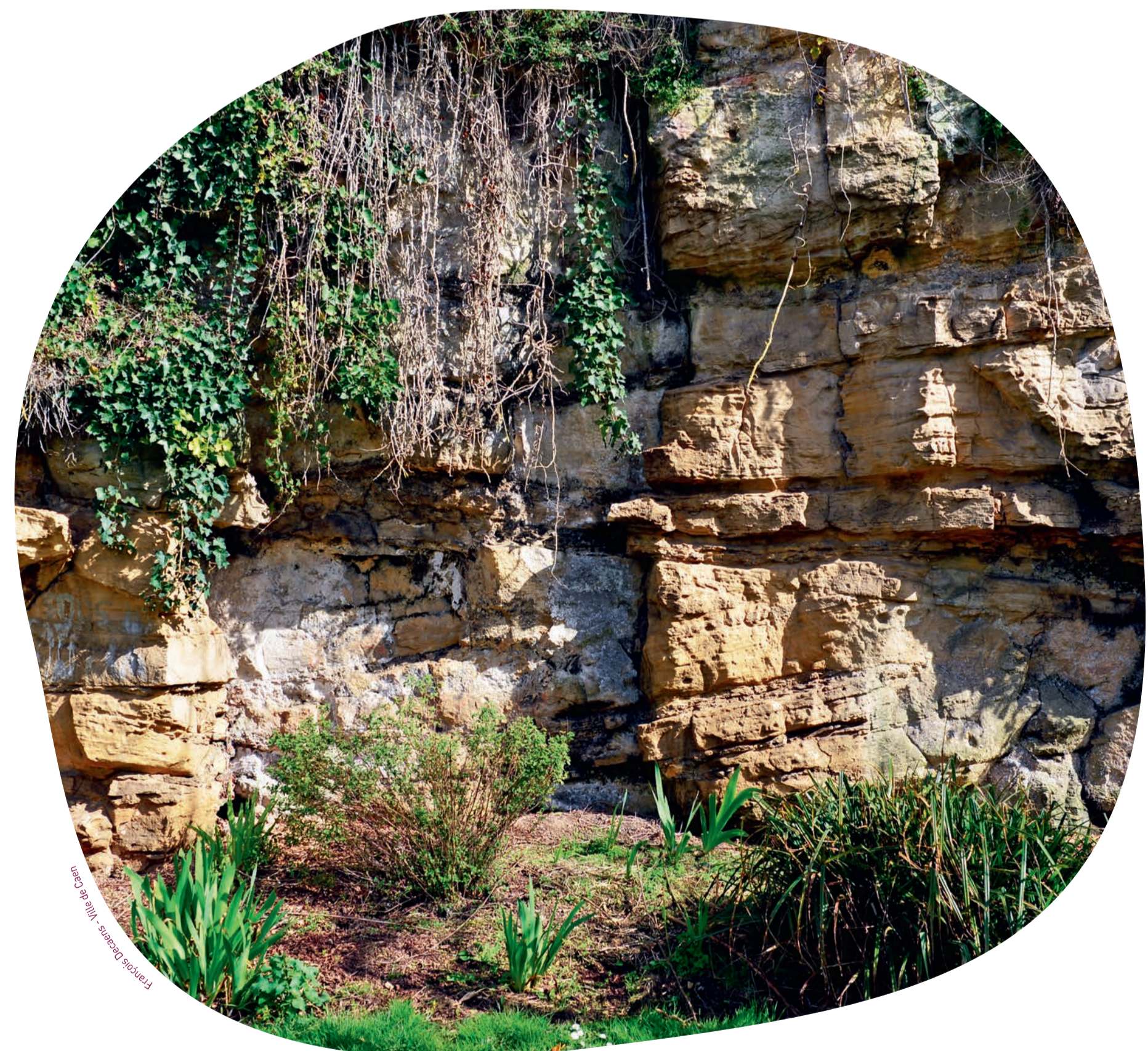
Front de taille.