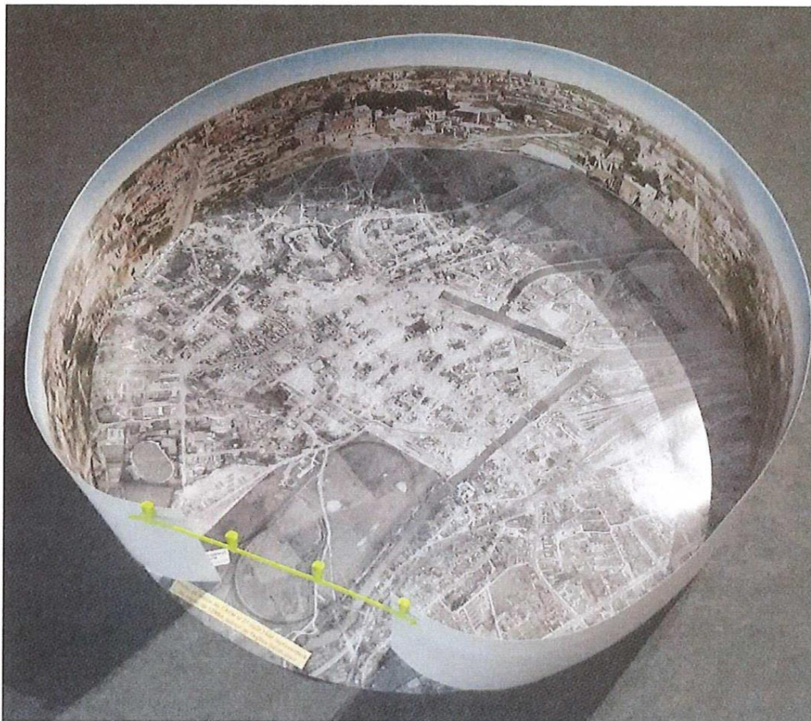
Maquette avec le plan de 1946 au sol et le panorama de 1948 sur les côtés

Fonds Delasalle colorisé par R.Stepkow : panorama pris de St Jean en 1948 – Présentation dans la Salle J.Poirier de l'Abbaye aux Hommes