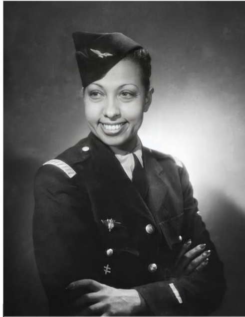
Joséphine Baker en uniforme de l'Armée de l'Air française en 1948

6 juin – 6 nov: Joséphine Baker, Libre et engagée – Partenariat Paris Match