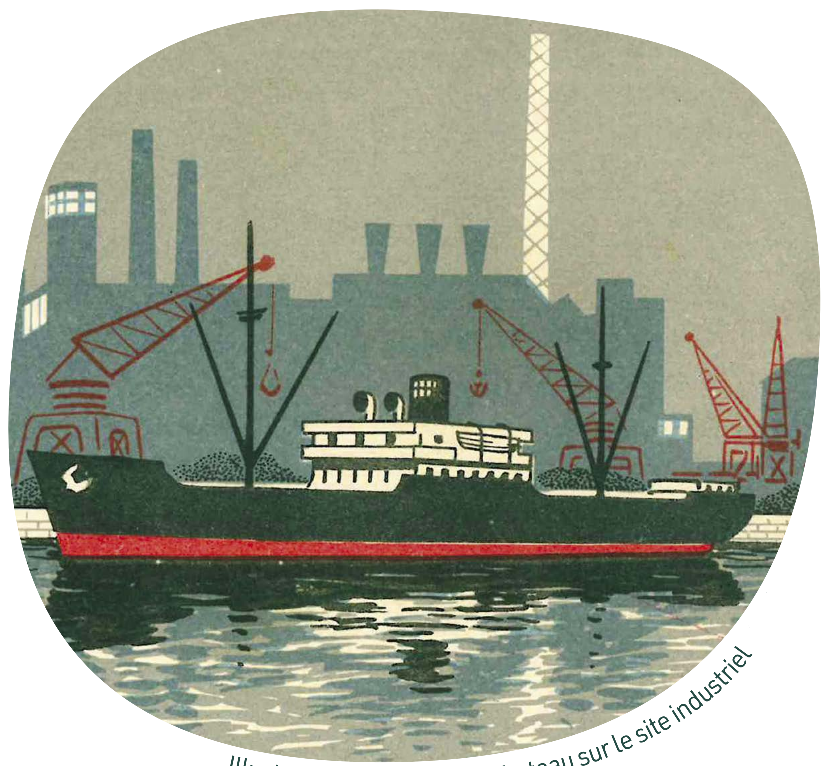
Illustration d'époque d'un bateau sur le site industriel

C'est un oiseau herbivore qui apprécie les eaux calmes et n'est pas farouche. Il s'est donc très bien adapté aux surfaces aquatiques créées par l'homme, comme les ports, les bassins ou les canaux.