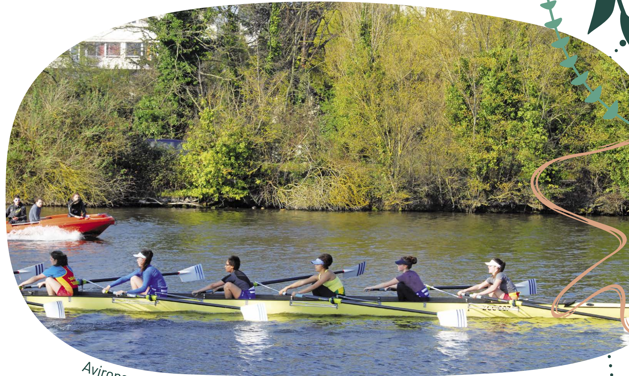
Avirons sur le canal