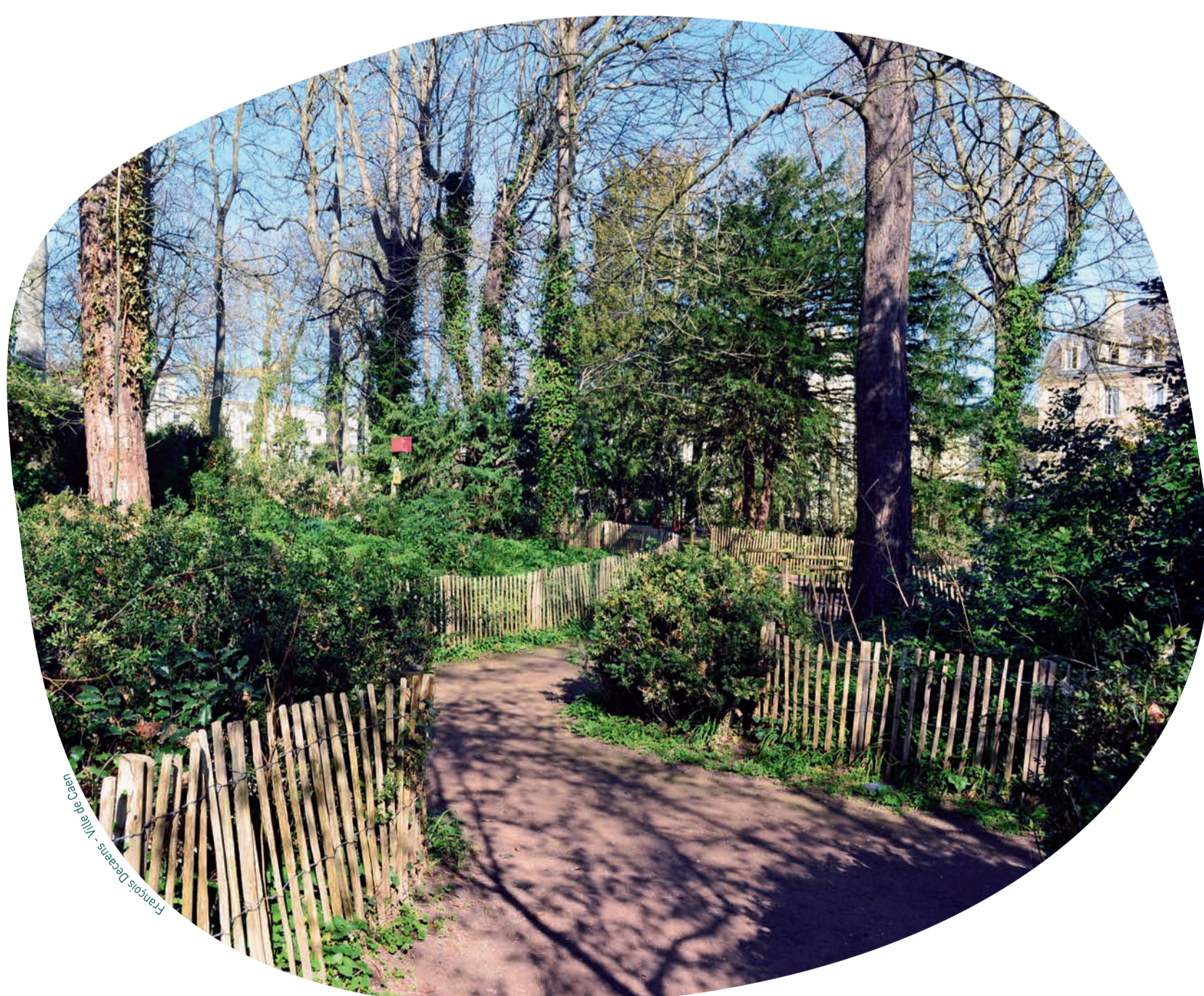
Espaces entourés de canisses.

Les premiers bulbes, qui deviennent par la suite des figues, mûrissent en quelques semaines. Les figuiers appartiennent à la famille des mûriers. Ses fruits ont un goût sucré, sont riches en vitamines et sources d'antioxydants. La figue peut être dégustée fraîche de juillet à septembre ou séchée toute l'année.