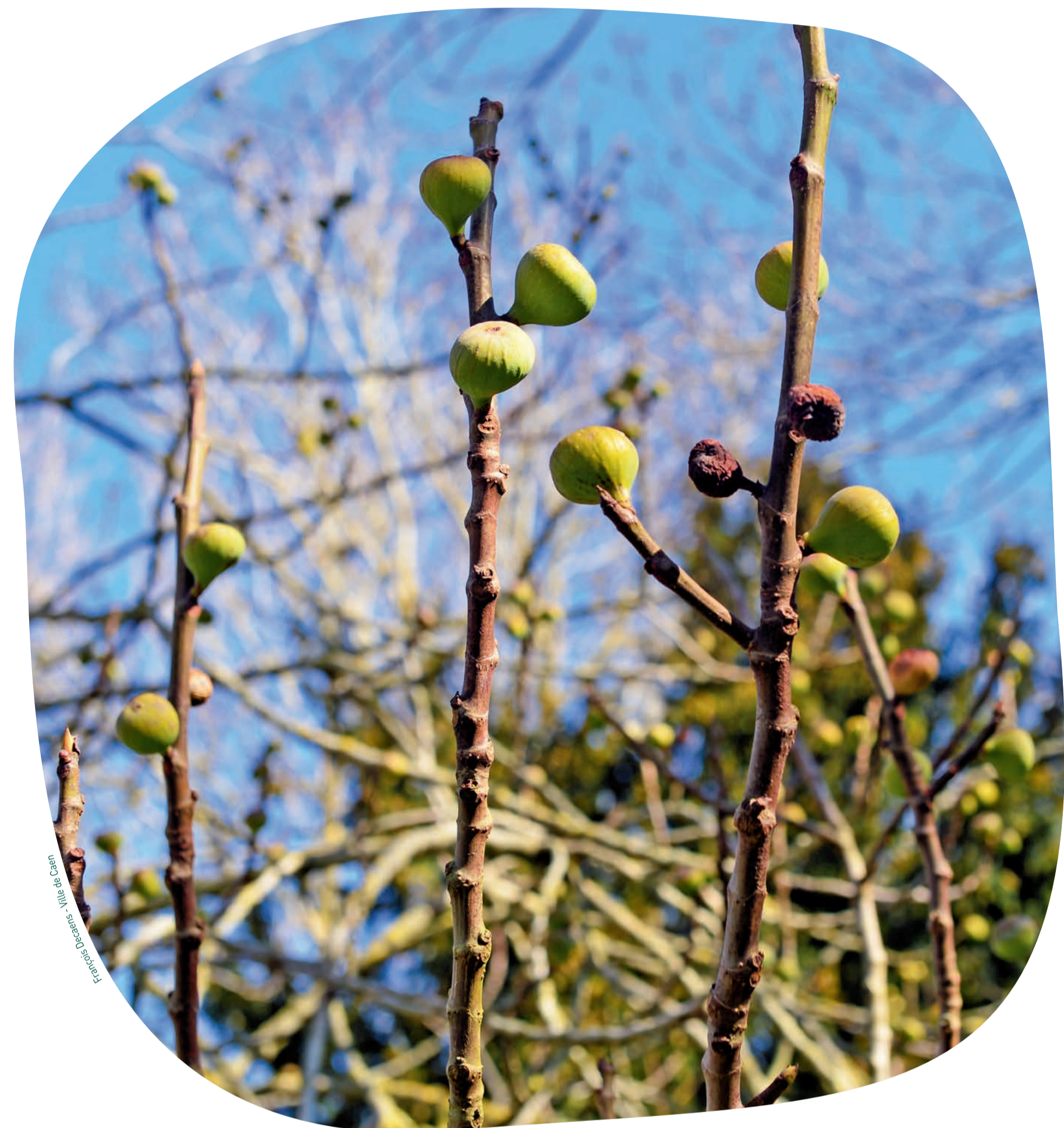
Bulbes du figuier.

B ienvenue au parc Saint-Paul. Ce lieu familial regorge d'arbustes tout en couleur et d'arbres majestueux qui font de cet espace un sous-bois. Une fauche tardive permet aussi de préserver le cycle des végétaux et l'habitat de la faune variée du parc (plus particulièrement, les larves d'insectes et de coléoptères). Sa gestion est caractérisée par des espaces de nature protégés de canisses pour que l'homme puisse les admirer sans les dégrader ! Parmi les grands arbres dressés, on trouve un hêtre pourpre au centre du parc. Son nom est inscrit sur une plaque accrochée à son tronc. Sa hauteur est impressionnante. Son houppier culmine à 28 m. Le Sequoiadendron Giganteum du jardin des plantes est encore plus haut : planté en 1890, ce séquoia géant mesure aujourd'hui 38 m de haut et il est muni à son sommet d'un paratonnerre pour sa protection. Côté sud, on peut découvrir un « tas de pierres sèches » sur le sol. À quoi et à qui peut-il bien servir ? Trouvez le et vous pourrez lire la réponse. Côté entrée principale, vous pouvez admirer un arbre caduc aux grandes feuilles : en effet, le figuier ne conserve pas ses feuilles en hiver. La majorité des feuillus sont caducs, contrairement aux résineux qui sont principalement des persistants. La fructification du figuier intervient au printemps et en été.