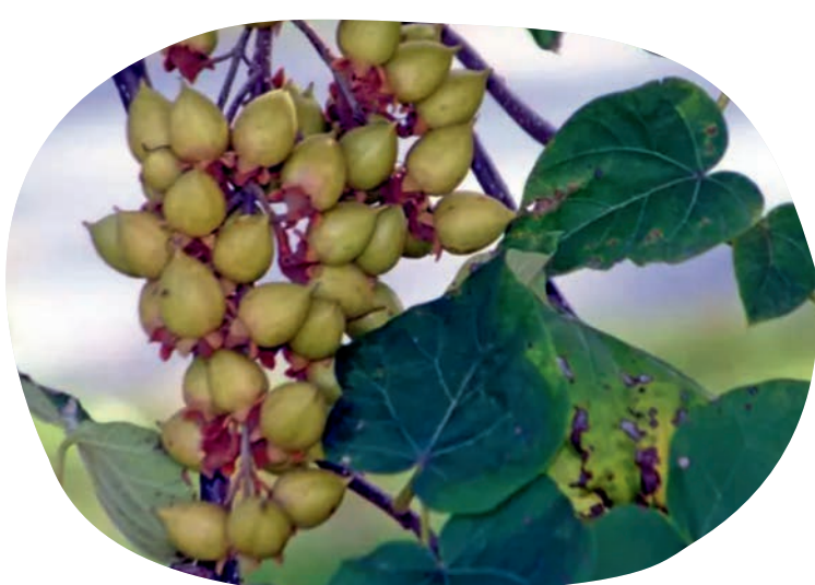
Fruit de Paulownia.