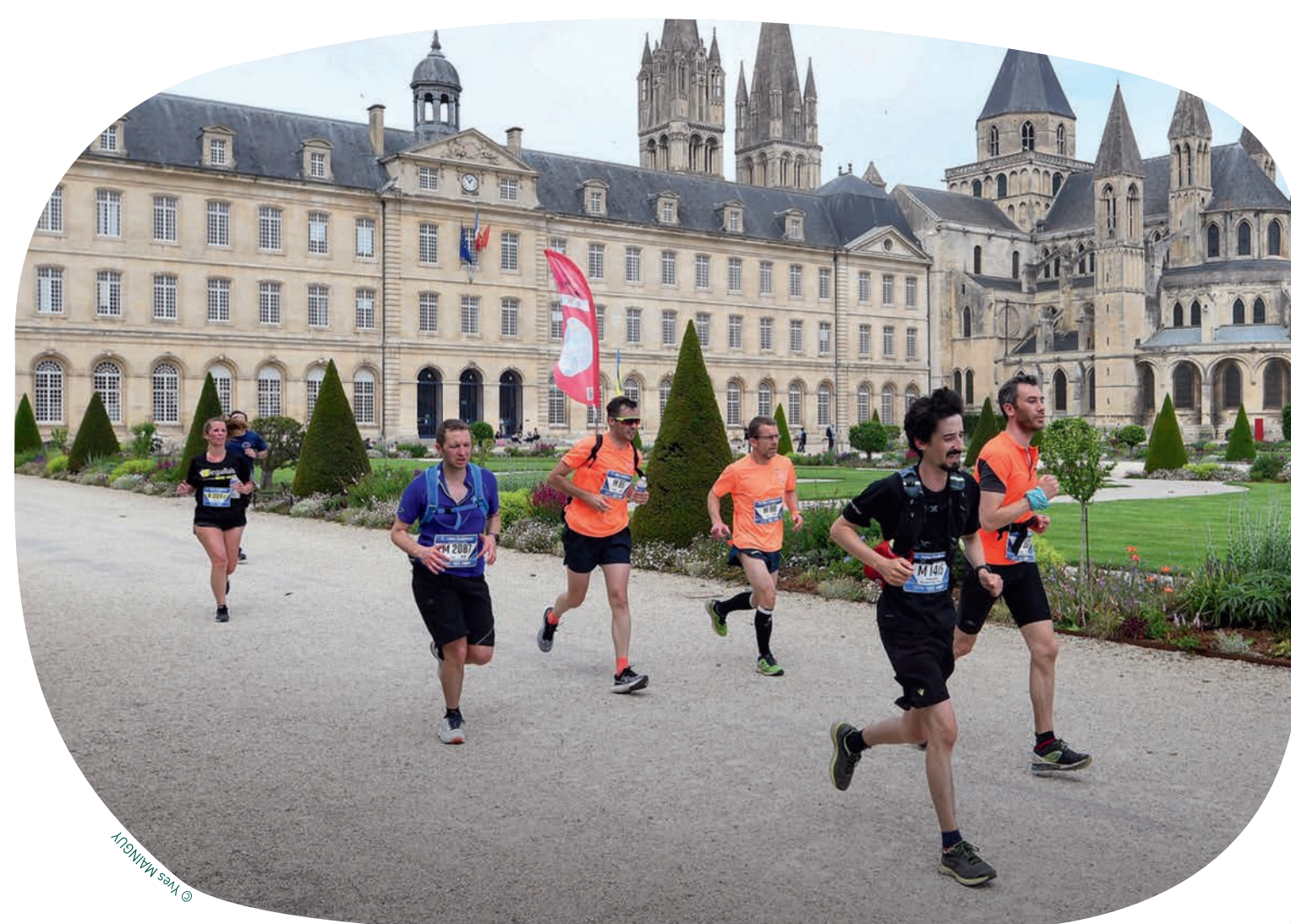
Marathon de Caen.