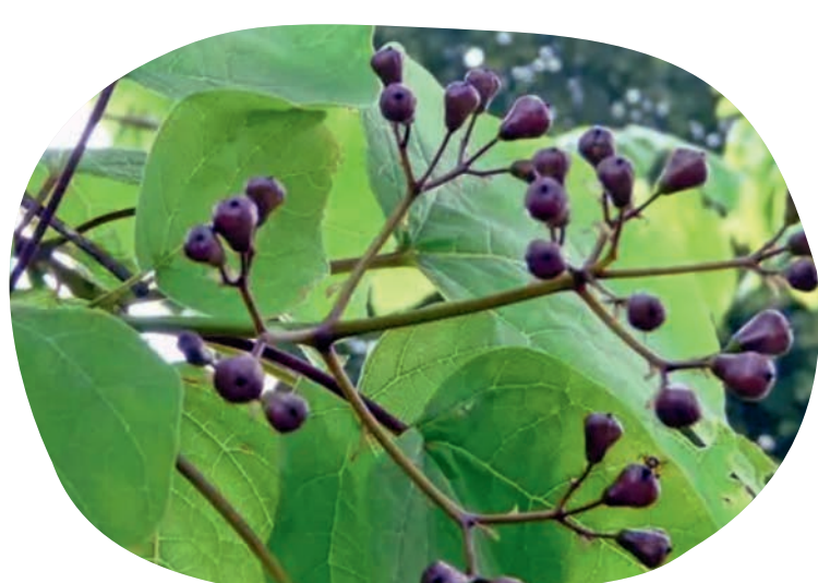
Fruit de Catalpa.