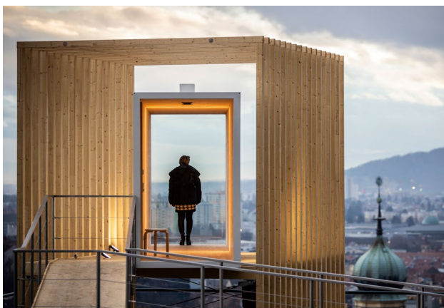
Les Veilleurs de Graz

Les inscriptions sont ouvertes à partir du mercredi 24 janvier sur lesveilleursdecaen.fr . Chaque participant pourra choisir une date, puis un créneau de veille, au lever et au coucher du soleil. Les veilleurs seront ensuite contactés pour assister à un atelier préparatoire pour en savoir plus sur cette performance artistique collective.