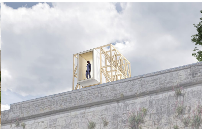
Le futur abri-objet caennais