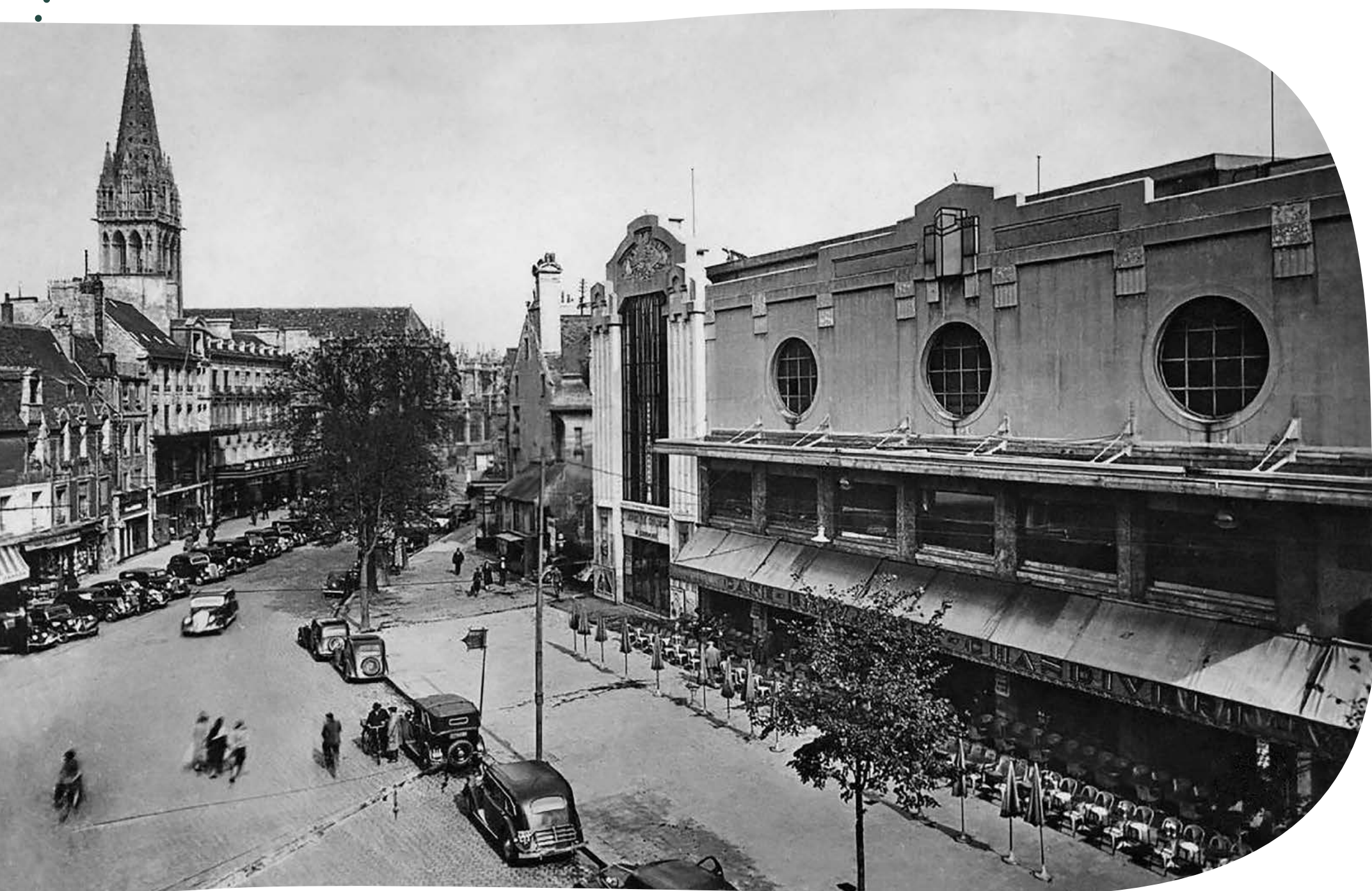
La brasserie Chandivert

Après le recouvrement des cours d'eau, un espace nouveau a pris place dans la ville, une sorte de boulevard intérieur ! Pendant les années d'avant-guerre y régnait la brasserie Chandivert, avec ses terrasses et ses spectacles. Joséphine Baker y chanta, Simenon la décrit dans ses romans. La fontaine actuellement installée occupe l'emplacement, qui était autrefois celui de la « fontaine des Trois Grâces » (aujourd'hui toujours visible dans le parc de la mairie de Langrune-sur-Mer).