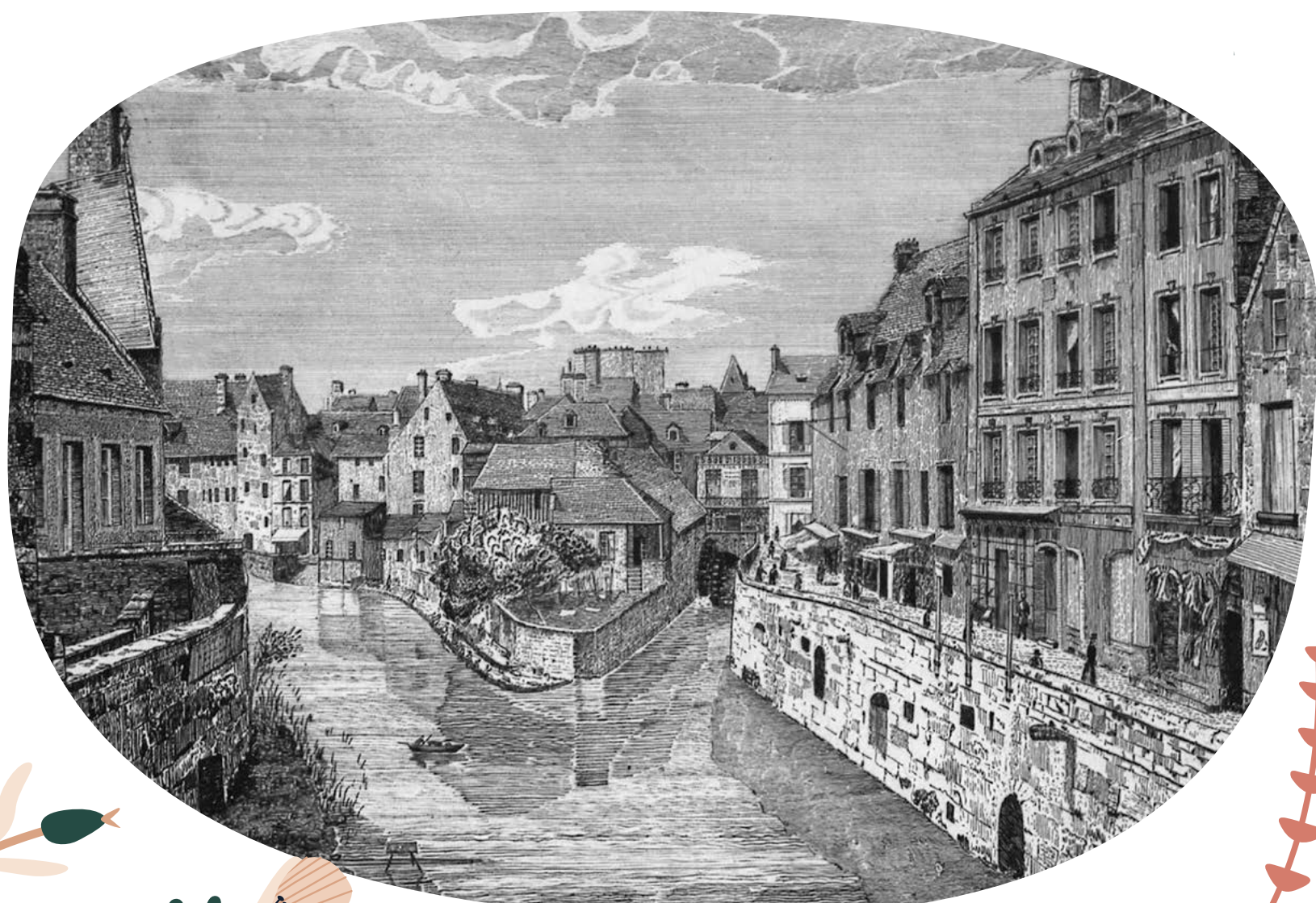
Confluence des cours d'eau