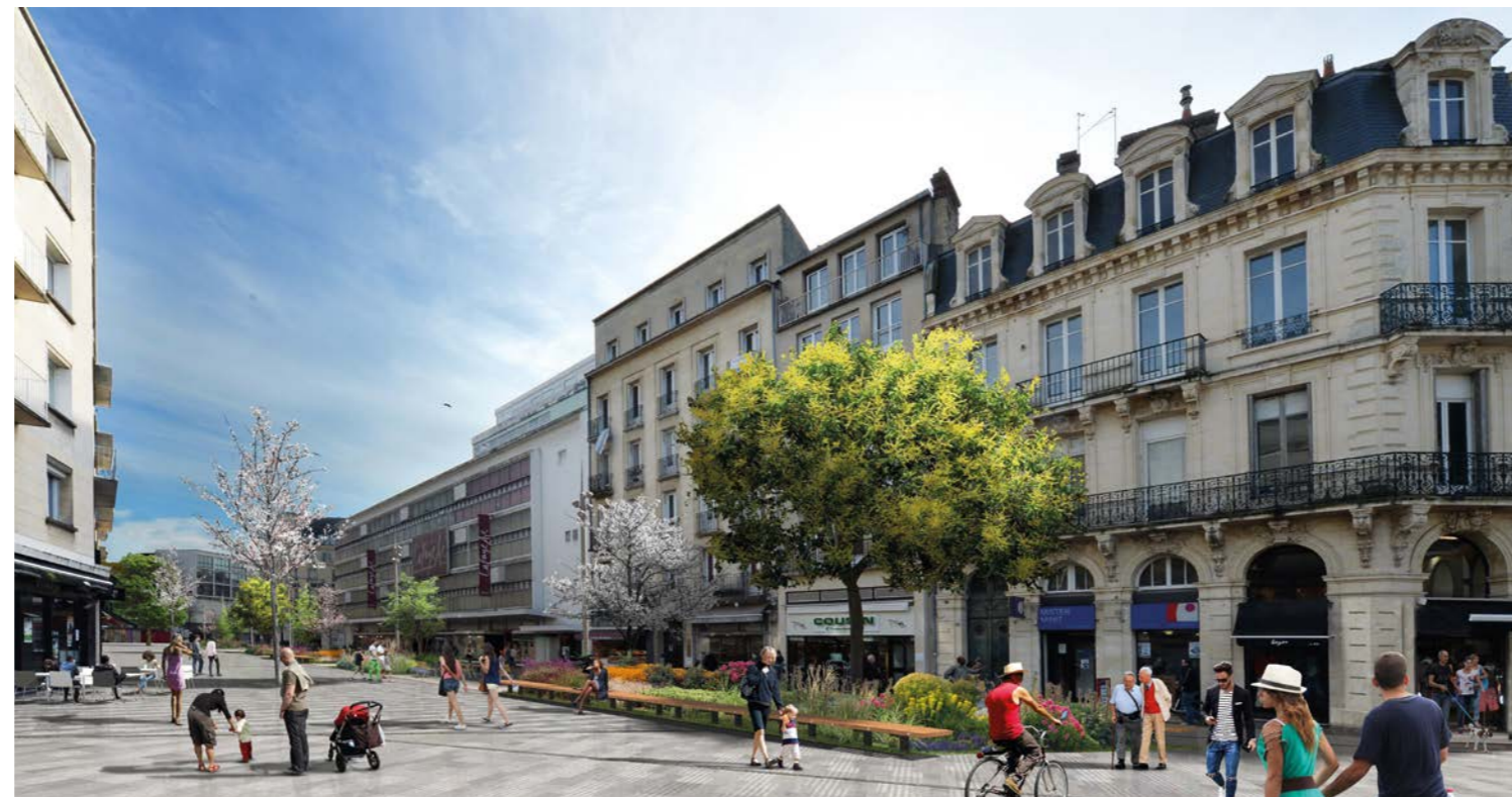
L'aménagement du boulevard Leclerc vise à créer un nouvel axe piéton, unifier l'espace public, mettre en valeur les monuments historiques (Hôtel de Than, église Saint-Pierre...) et créer de vrais lieux de vie. Cet aménagement est en lien direct avec le projet de renouvellement du Tram. Livraison : été 2019.

La Mairie de Caen a décidé de mettre en place une Commission d'Indemnisation Amiable des pertes économiques (CIA) liées aux travaux d'aménagement des espaces publics du boulevard Maréchal Leclerc et des rues adjacentes (rue Hamon et rue du Moulin) ainsi que de la place de la République et de ses rues adjacentes (rue Pierre-Aimé Lair, rue du Pont Saint-Jacques, rue de la Fontaine) .