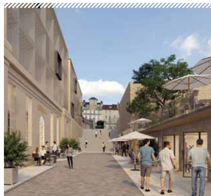
La rue du Baillage sera ouverte aux promeneurs.

L'opérateur a également prévu de rouvrir au public la liaison entre la place Saint-Sauveur et la rue Saint-Manvieu : la rue du Baillage, qui devrait accueillir quelques boutiques. La Ville restera propriétaire des lieux, sous la forme d'un bail emphytéotique de 99 ans. Le dépôt du permis de construire est prévu pour fin 2020.