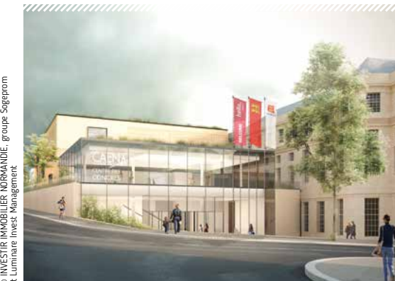
Rue Saint-Manvieu, le futur centre des congrès disposera d'une salle de conférence de 500 places.