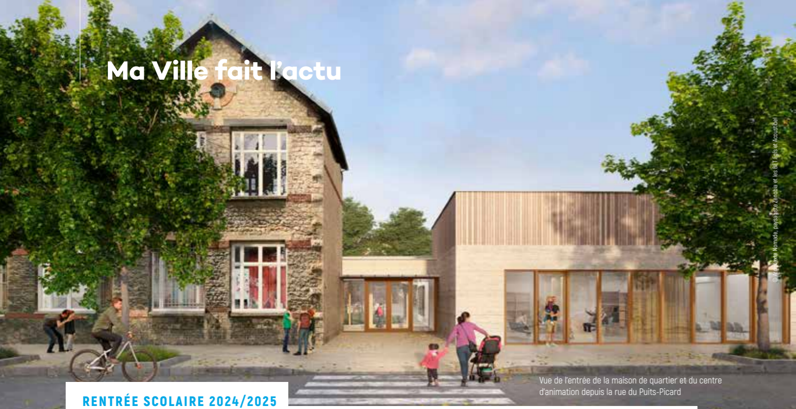
© A. Kromm, paysagiste Zénobia et les BEI Epis et Acoumbal