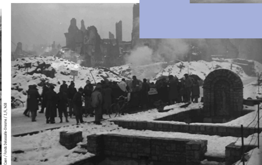
Pendant l'hiver 1944, distribution de repas par l'Aide Française, place Saint-Pierre.