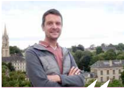
PIERRE 22 JUILLET, 6H21

JUSQU'AU 20 MARS 2025, LES CAENNAISES ET LES CAENNAIS SONT INVITÉS À VEILLER MATIN ET SOIR SUR LEUR VILLE DEPUIS UN POSTE D'OBSERVATION SITUÉ DANS LE CHÂTEAU. CONÇUE PAR LA CHORÉGRAPHE JOANNE LEIGHTON, CETTE EXPÉRIENCE UNIQUE EN SON GENRE EST GRATUITE, SUR INSCRIPTION. TÉMOIGNAGES.