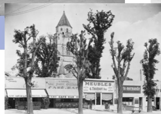
Les commerçants sinistrés reprennent leur activité dans des baraquements provisoires.