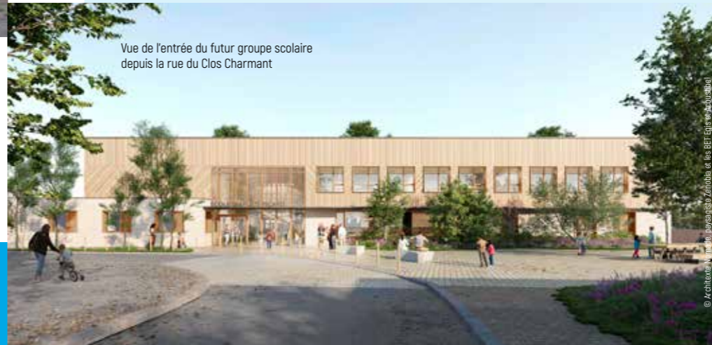
Vue de l'entrée du futur groupe scolaire depuis la rue du Clos Charmant

démographique du quartier et les nouvelles constructions dans les secteurs Saint-Jean-Eudes et Clemenceau ». Une attention particulière sera apportée à l'espace extérieur et aux aménagements paysagers. Performant écologiquement, l'ensemble sera rattaché au réseau de chaleur urbain et complété par des panneaux photovoltaïques installés sur le toit. À terme, la démolition de l'ancienne école est prévue mais le bâtiment historique sera réhabilité pour accueillir le centre d'animation. « L'intérêt est de mutualiser ce qui peut l'être, comme les espaces de restauration. On associe régulièrement les élèves, les parents, les équipes... Ils apprécient de pouvoir suivre le chantier et ses différentes phases. »