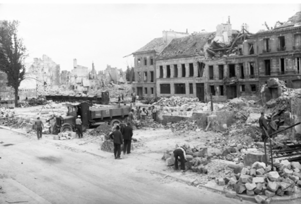
Après l'été 1944, le déblaiement des décombres est un travail titanesque. Ici, rue des Carmélites.