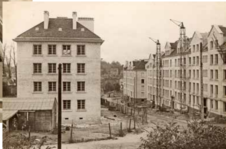
Les immeubles de la rue du Gaillon font partie des premiers à être achevés.

D ans l'immédiat après-guerre, alors que les autorités locales doivent parer au plus pressé pour déblayer les décombres et gérer le retour des habitants sinistrés, il faut en parallèle élaborer le plan qui va permettre à la ville de renaître de ses cendres. Ce processus va prendre trois années, de 1945 à 1947. Le programme est établi sous l'égide du ministère de la Reconstruction et de l'Urbanisme mais sur le terrain, trois personnalités locales jouent un rôle de tout premier ordre dans la définition du nouveau visage de Caen.