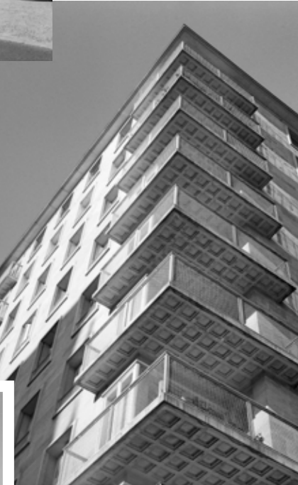
Tour Marine, place de la Résistance.