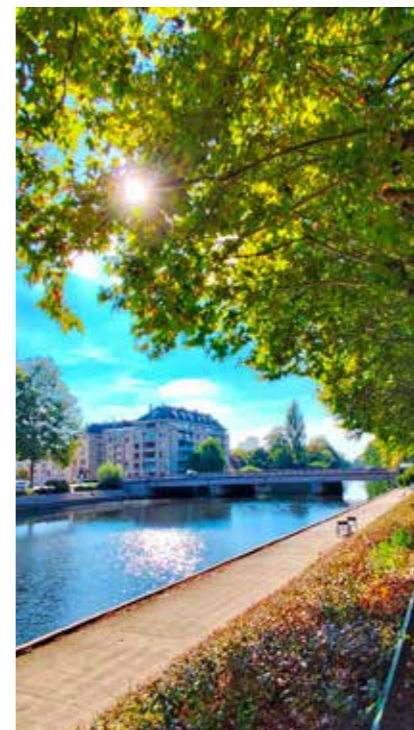
Quel bonheur cette ville 🍂🍂🍂 @CaenOfficiel