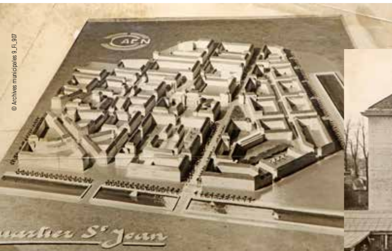
Le plan de la Reconstruction est adopté par le conseil municipal en 1947.

AU SORTIR DE LA GUERRE, RECONSTRUIRE CAEN RÉPOND D'ABORD À LA NÉCESSITÉ DE RÉPARER LES DOMMAGES DES BOMBARDEMENTS ET DE RELOGER DANS DE BONNES CONDITIONS LES HABITANTS. C'EST AUSSI L'OCCASION DE REPENSER ET DE MODERNISER LA VILLE EN PROFONDEUR.