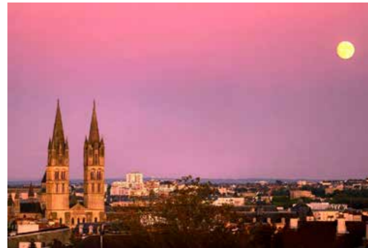
17 septembre #caen #normandie