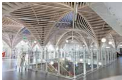
f @Universite_Caen 26 septembre

Le saviez-vous ? La Bibliothèque universitaire Madeleine-Brès fête ses 10 ans cette année ! 🎉 Abrisée au PFRS (Pôle des formations et de recherche en santé), sur le campus 5 de l'université de Caen Normandie, la BU Santé séduit les étudiants & étudiantes par son architecture remarquable, son mobilier moderne et sa grande salle d'études, baignée de lumière. ✨