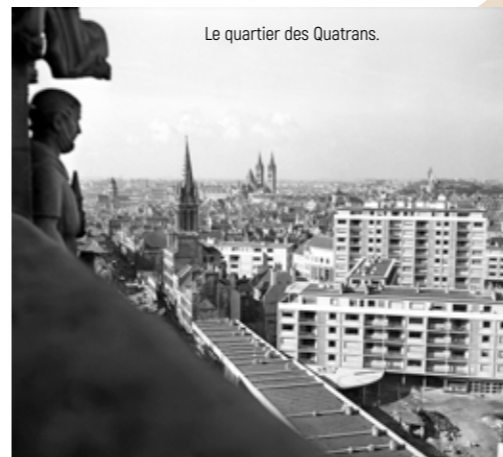
Le quartier des Quatrans.

La Reconstruction de Caen se caractérise par la volonté de conférer à la ville une unité architecturale en ayant recours à des formes classiques et à des matériaux traditionnels comme la pierre de Caen. Une nouvelle structuration est apportée à l'île Saint-Jean : l'avenue du Six-Juin, imaginée comme une « voie triomphale », dote le cœur de ville d'une nouvelle traversée nord/sud tandis que la rue Saint-Jean est élargie. Les éléments forts du patrimoine historique, autrefois engoncés dans un bâti très dense, sont dégagés et mis en valeur comme les églises Saint-Jean et Saint-Pierre ainsi que la vaste enceinte du Château. Ce nouveau schéma urbain beaucoup