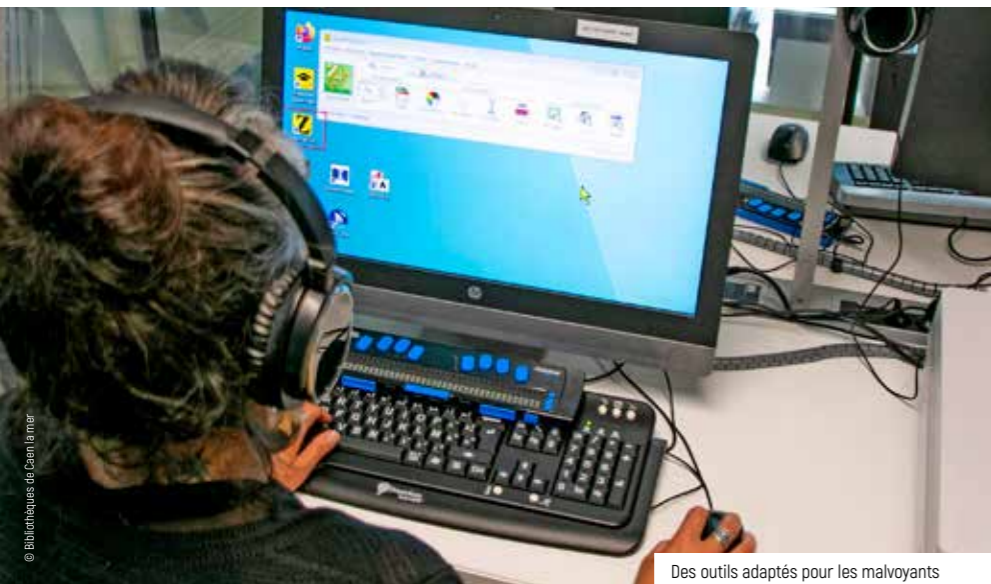
Des outils adaptés pour les malvoyants