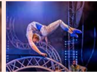
Cirkus Cirkör