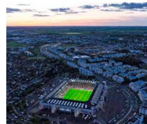
Une lueur dans la nuit, d'Ornano 🏠🍷 #SMCaen #TeamSMC #Caen #Football #Ligue2 #Ligue2BKT