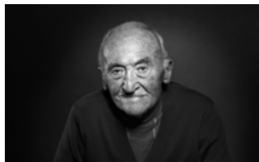
X @CaenOfficiel 18 septembre