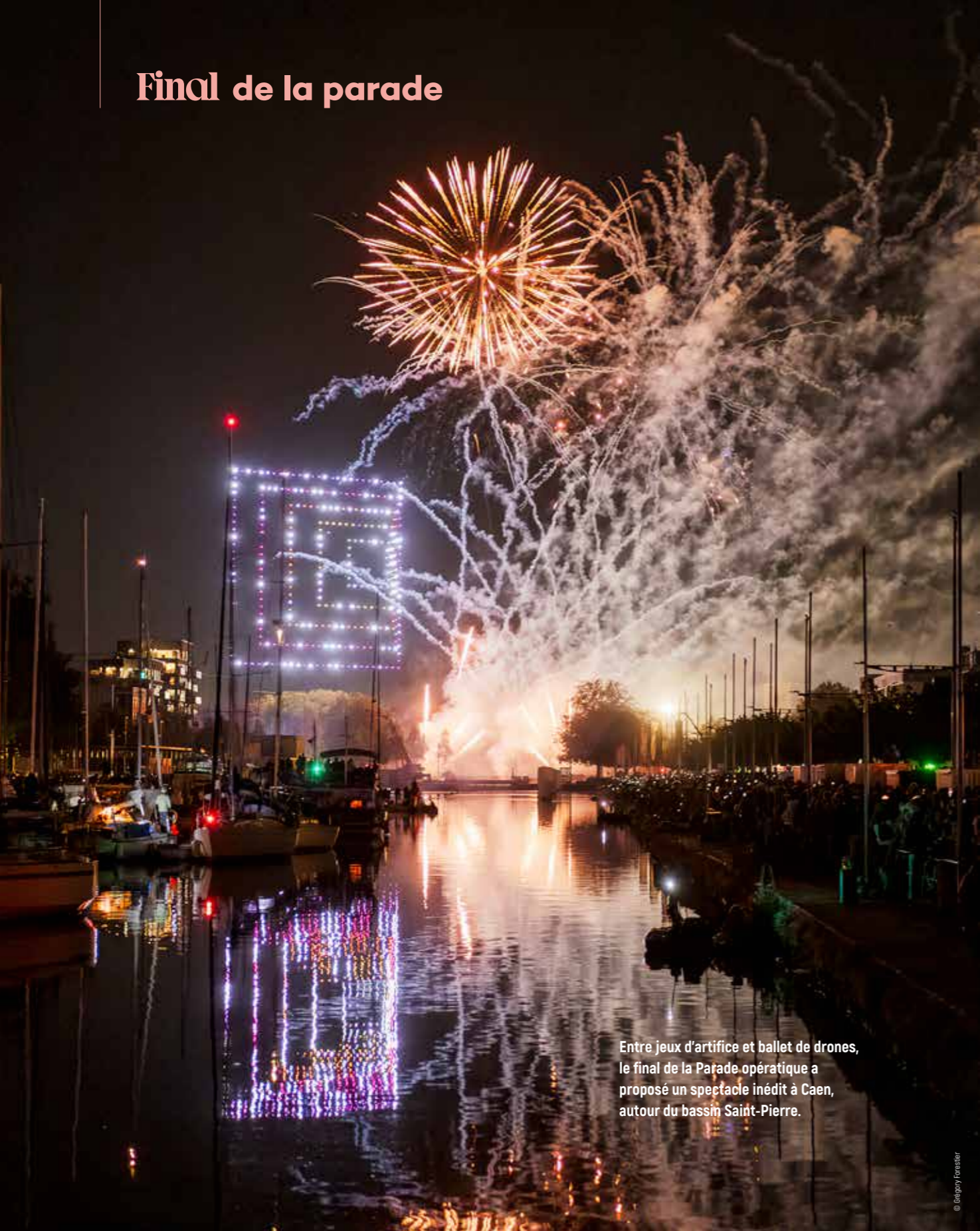
Entre jeux d'artifice et ballet de drones, le final de la Parade opératique a proposé un spectacle inédit à Caen, autour du bassin Saint-Pierre.