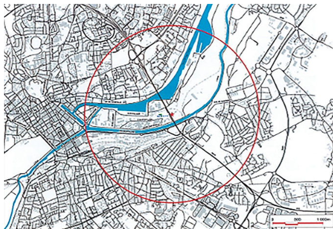
Le Plan Particulier d'Intervention (PPI) de DPC, dont la dernière version date de mai 2022, s'applique dans un rayon de 1 415 m autour du dépôt.

Le dépôt exerce son activité (chargement camions et stockage des produits) depuis 1950. L'arrêté préfectoral du 4 décembre 2002, modifié par différents arrêtés préfectoraux successifs dont le dernier en date est celui du 6 juillet 2017, autorise l'exploitation des installations du dépôt. La superficie du dépôt est de 5.4 Ha, sa capacité de stockage est de 61 000 m 3 . La réception des produits stockés se fait par canalisation de transport et par camions.