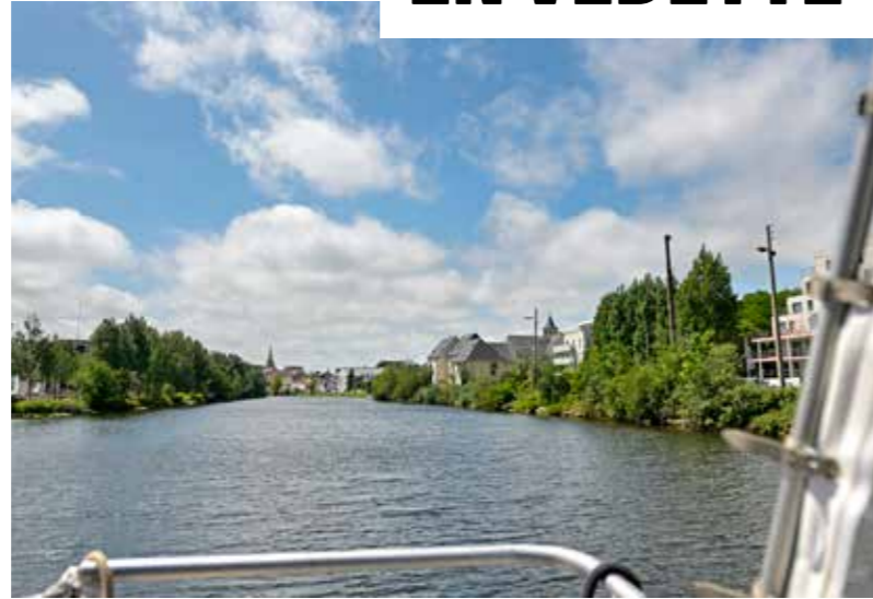
© Ville de Caen / Ch. Lormeau

PROFITEZ DE L'ÉTÉ POUR (RE)DÉCOUVRIR LA PRESQU'ÎLE, VUE DEPUIS LES EAUX CALMES DU CANAL MARITIME. À BORD DES VELETES CAENNAISES, LA BALADE D'UNE HEURE EST AUSSI PLAISANTE QU'INSTRUCTIVE.