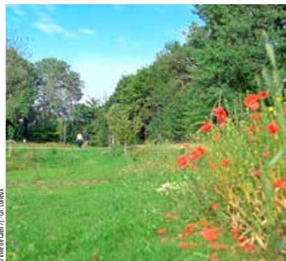
Les noues (fossés humides) du parc de Secqueville servent à absorber et filtrer les eaux de pluie du secteur.

Cette place plus grande laissée au développement des milieux naturels ne se fait pas au détriment des habitants qui fréquentent le parc. Dans la Vallée des Jardins, les cyclistes empruntant le Périph'vélo sont de plus en plus nombreux. Promeneurs, familles et sportifs ont