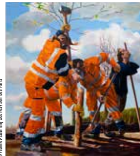
Laurent Proux, Les jours et les heures. Le travail. Place de la Liberté, La Guérinière, Caen, 2026 , Huile sur toile

⊕ Musée de Normandie, salles du Rempart De 5 à 7 € (gratuit -26 ans et pour tous le 1 er week-end du mois) musee-de-normandie.caen.fr