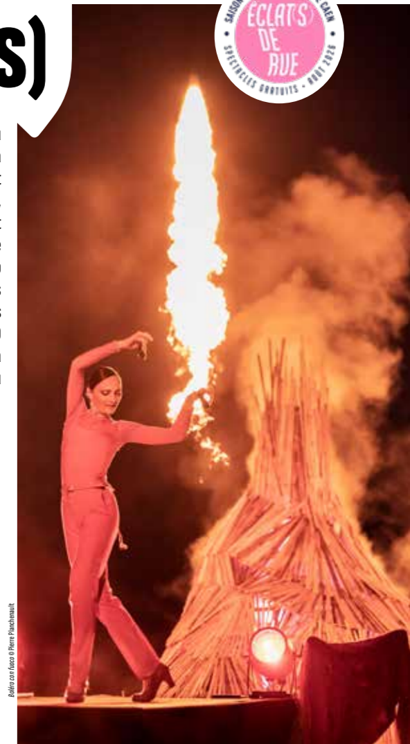
Ballé en face © Pierre-François