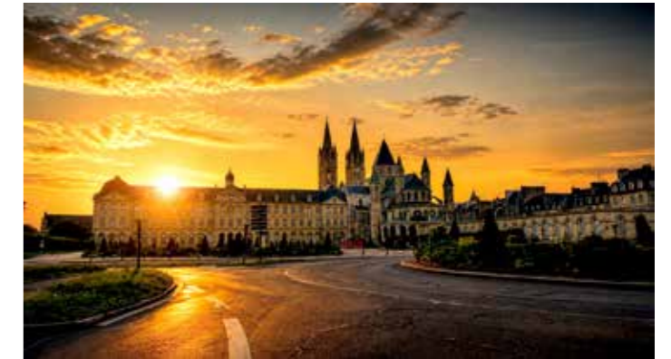
📷 Un moment hors du temps capturé vendredi dernier